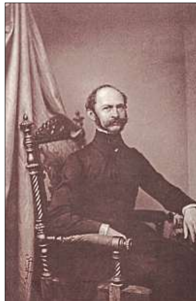
König Maximilian II. (1848–1864).