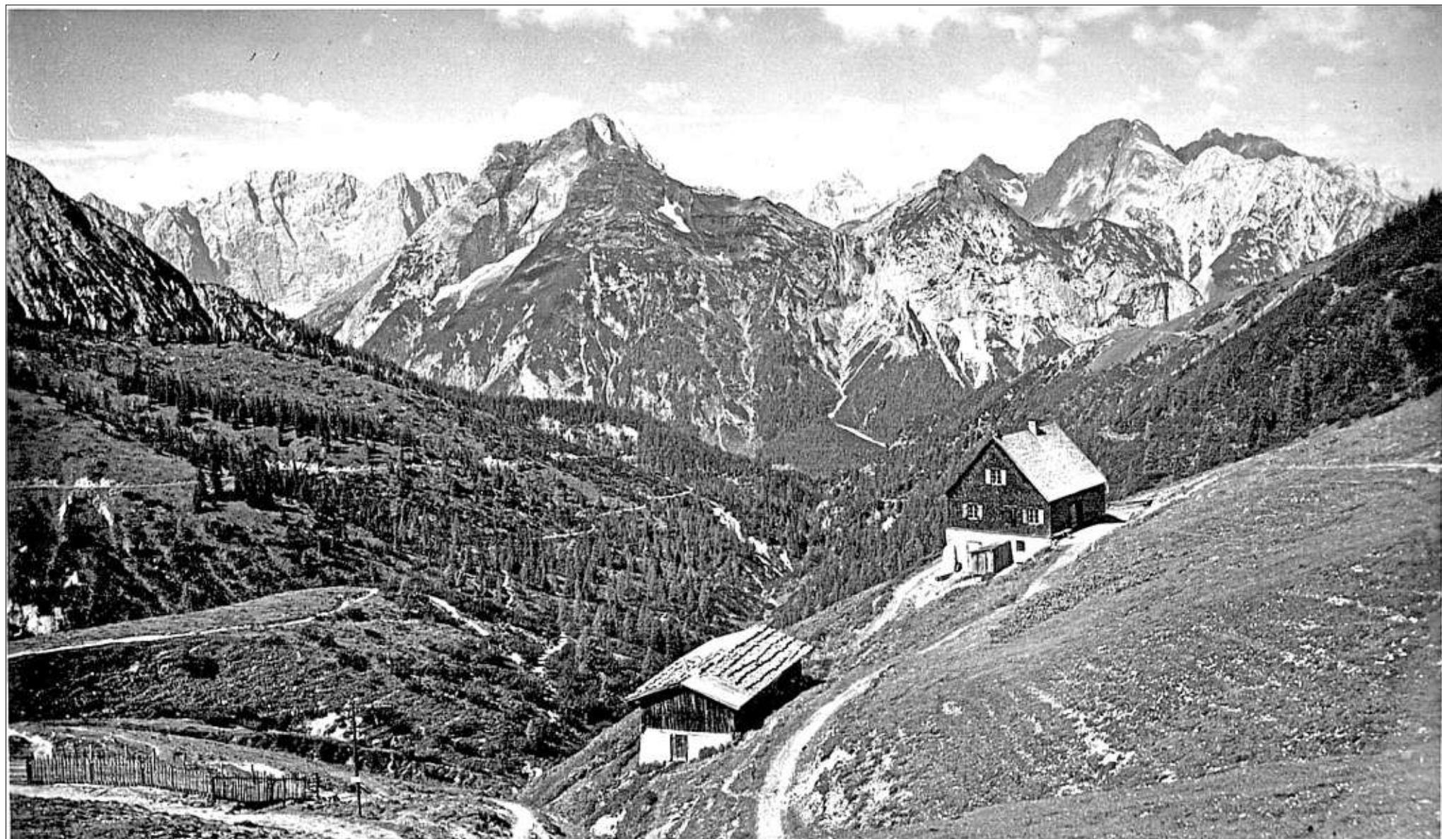
Am Plumser Joch dinierte die königliche Gesellschaft.