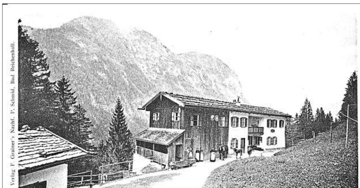
Die Schwarzbachwacht: Im Volksmund wird sie auch „das Wachterl“ genannt.

Die Reise näherte sich dem Ende, als die royale Wandergruppe am 26. Juli nach Lofer und von dort nach Unken gelangte, „dem herrlichen Saalachtal entgegen, dem Freund der Alpenwelt eine reiche Augenweide zu bieten“, wie Bodenstedt schwärmerisch zurückblickte. Am letzten Reisetag brach man frühmorgens auf;