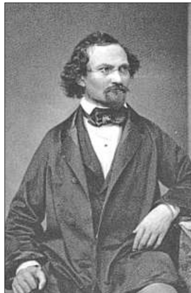
Friedrich von Bodenstedt.