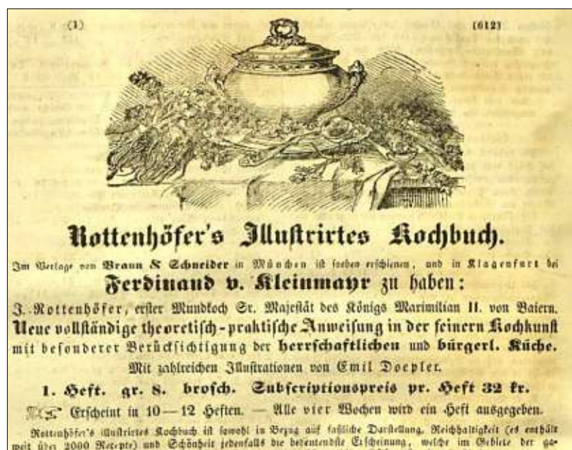
Werbung für das Rottenhöfersche Kochbuch.

Dank Rottenhöfers unvergleichlicher Kochkunst war es gelungen, „die Gerichte nicht anders zu bereiten als in der Münchner Schloßküche“, schwärmte Riehl in seinen Erinnerungen. Und ob-