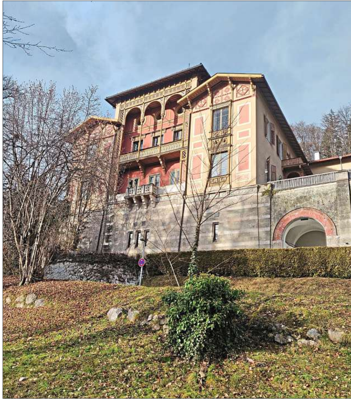
Königliche Villa in Berchtesgaden - ohne alpenländische Stilelemente.

Unter dem Titel „Eine Fußreise mit König Max“ erschien 1871 aus der Feder des als Professor für Kulturgeschichte an die Münchener Universität berufenen Wilhelm Heinrich Riehl eine der beiden Beschreibungen jener denkwürdigen Reise von 1858. Max II. hatte den vielseitig talentierten Riehl, dessen volkskundliche Vorlesungen zu den meistbesuchten der Universität gehörten, als anregenden Gesprächspartner für seine Reise ausgewählt. Die Ehre eines Reisebegleiters fiel auch Friedrich Bodenstedt zu, der sich als Professor für slawische Sprachen in der bayerischen Residenzstadt einen Namen gemacht hatte. Bodenstedt fasste seine zunächst nur tagebuchartig notierten Reiseim-