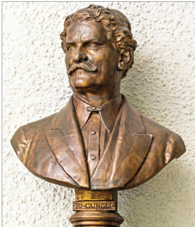
Die ehemalige Gung'l-Büste in der Konzertrotunde in Bad Reichenhall.

Die lange Tradition des Reichenhaller Kurorchesters begann, als am 6. Februar 1868 der Kontrakt zwischen dem Münchener Kapellmeister Josef Gung'l und dem durch das königliche Badkommissariat vertretenen Reichenhaller „Badcomitée“ zustande kam. Wie sehr die Etablierung des neuen Reichenhaller Orchesters von vielen Seiten begrüßt wurde, konnte man am 26. April 1868, kurz vor Beginn des sommerlichen Kurbetriebs, dem „Bayerischen Landboten“ entnehmen: „Den vielen Besuchern von Nah