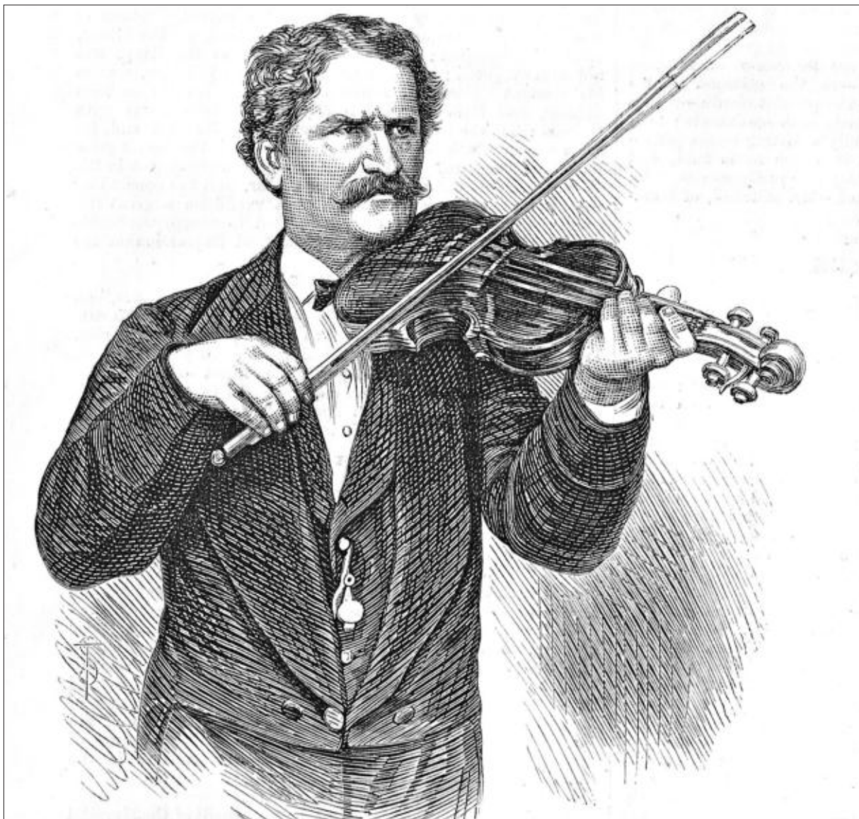
Nicht nur Kapellmeister und Komponist: Josef Gung'l beherrschte das virtuose Geigenspiel.