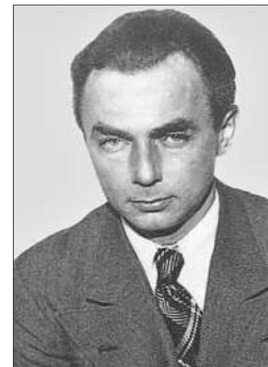
Erich Kästner gastierte für längere Zeit in Bad Reichenhall.

Salzburg keine halbe Bahnstunde auseinanderliegen. Eisenbahnverbindungen sind vorhanden. Der Paß ist in Ordnung. So werde ich denn für meine Person den sogenannten kleinen Grenzverkehr permanent gestalten. In Reichenhall werde ich als Grandseigneur leben, in Salzburg als Habenicht; und jeden Tag werde ich der eine und der andere sein. Welch komödiantische Situation! Und da haben die Herren Dichter Angst, die Erde könnte, infolge des Fortschritts, unromantisch werden!