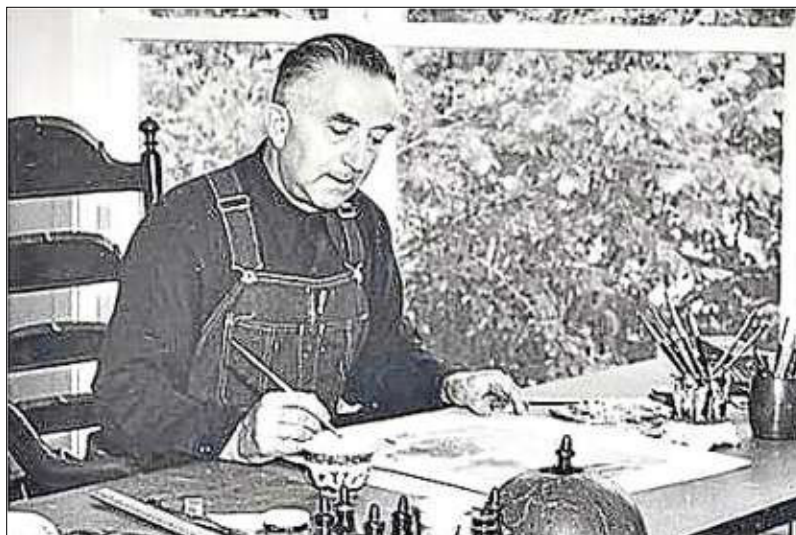
Illustrator Walter Trier und Erich Kästner trafen sich in Salzburg für das neue Buchprojekt.