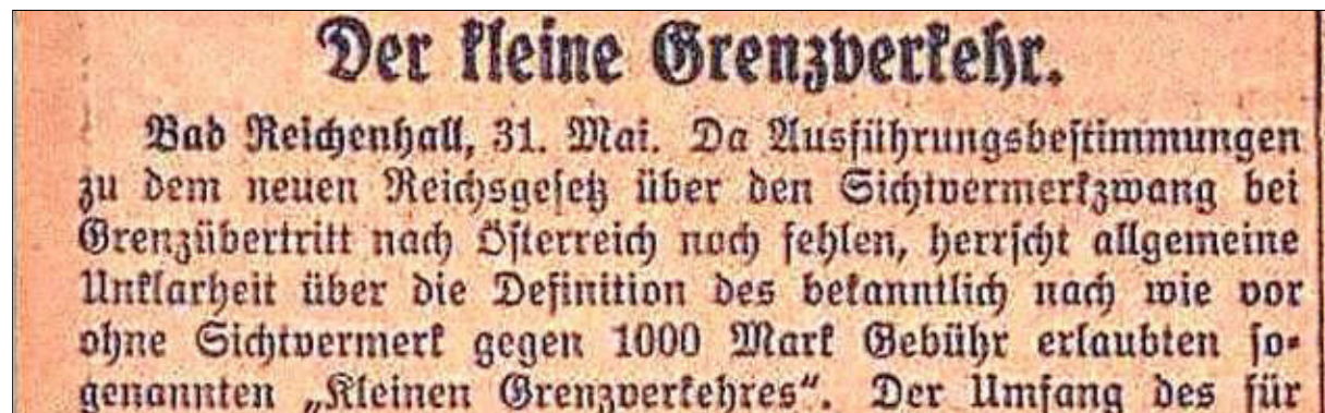
Einblick in die Zeitungsankündigung zur Durchführung des kleinen Grenzverkehrs.

burger Volksblatt“ vom 21. Juli 1931 schätzten die österreichischen Bundesländer den durch die „Reisetaxe“ zu erwartenden Entgang für den Fremdenverkehr in Vorarlberg auf drei, in Tirol auf 18, in Salzburg auf zehn, in Oberösterreich auf fünf bis sechs, in Kärnten auf fünf und in der Steiermark auf 2,5 Millionen Mark. Die deutsche Reichsregierung aber blieb zunächst unnachgiebig. Am 26. August 1931 – nach fünfwöchiger Dauer – wurde die Verordnung wieder aufgehoben.