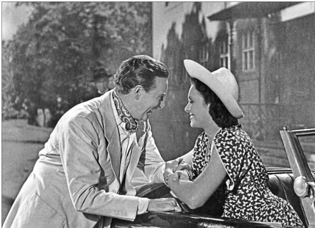
Filmszene in Bad Reichenhall aus „Der Kleine Grenzverkehr“, 1943.

Im „Kleinen Grenzverkehr“ lässt Kästner seinen Protagonisten, Georg Rentmeister, die Situation so beschreiben: „In Österreich ins Theater gehen, in Deutschland essen und schlafen: die Ferien versprechen einigermaßen originell zu werden! Mein alter Schulfreund hat mich davon überzeugt, daß Reichenhall und